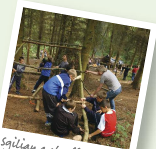
Sgiliau a chrefftau