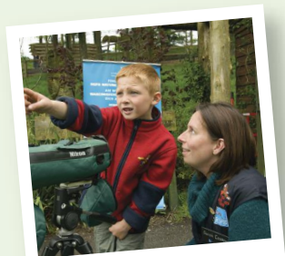
Hwyl dydd Gwener