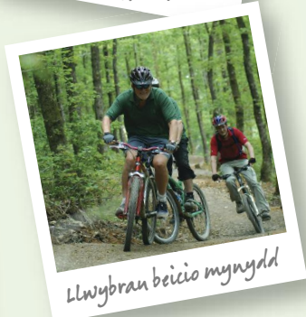
Llwybrau beicio mynydd