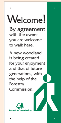
5 - i'w ddefnyddio ar byst, (250mm x 100mm).