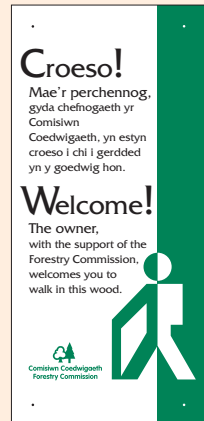
3 - fersiwn ddwyieithog i'w defnyddio yng Nghymru, (250mm x 100mm).