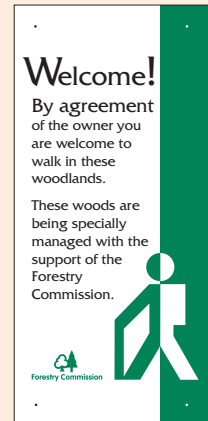
1 - i'w ddefnyddio ar byst (250mm x 100mm). Noder fod pob mesur mewn milimedrau, gyda'r uchder yn gyntaf.