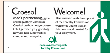
8 - fersiwn ddwyieithog i'w defnyddio yng Nghymru, (125mm x 265mm).