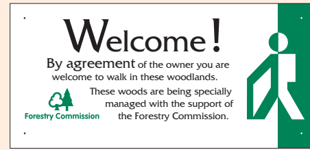
2 - i'w ddefnyddio ar glwydi ac adeiladau, (125mm x 265mm).