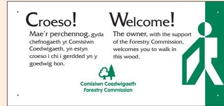
4 - fersiwn ddwyieithog i'w defnyddio yng Nghymru, (125mm x 265mm).