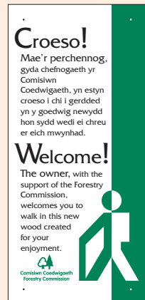
7 - fersiwn ddwyieithog i'w defnyddio yng Nghymru, (250mm x 100mm).