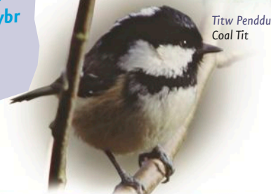
Titw Penddu Coal Tit