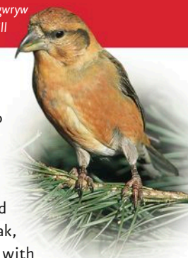
Gylfingroes gwryw Male Crossbill

During the late 18th century slate quarrying was the major occupation locally, employing over 800 men. When the quarries began to close in the 20th century the Forestry Commission became the main employer planting the hillsides around Aberllefenni and Corris. The maturing trees have transformed the views but, when quarrying was at its peak, each quarry had a cluster of buildings, with waterwheels, weighbridges, stables for the horses that pulled the trucks, tramways and vast spoil heaps. If you look carefully you can still find evidence of these.