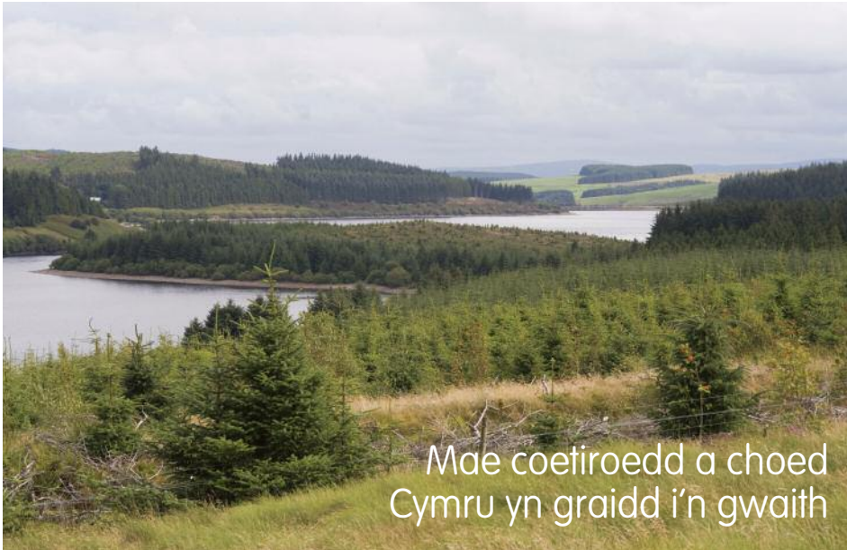
Mae coetiroedd a choed Cymru yn graidd i'n gwaith

Mae pum thema yng Nghoetiroedd i Gymru : mae'r thema gyntaf, 'coetiroedd a choed Cymru' yn elfen graidd o'n gwaith ac, yn amlwg, yn rhan annatod o bopeth rydym yn ei wneud. Dyma'r pedair thema arall: