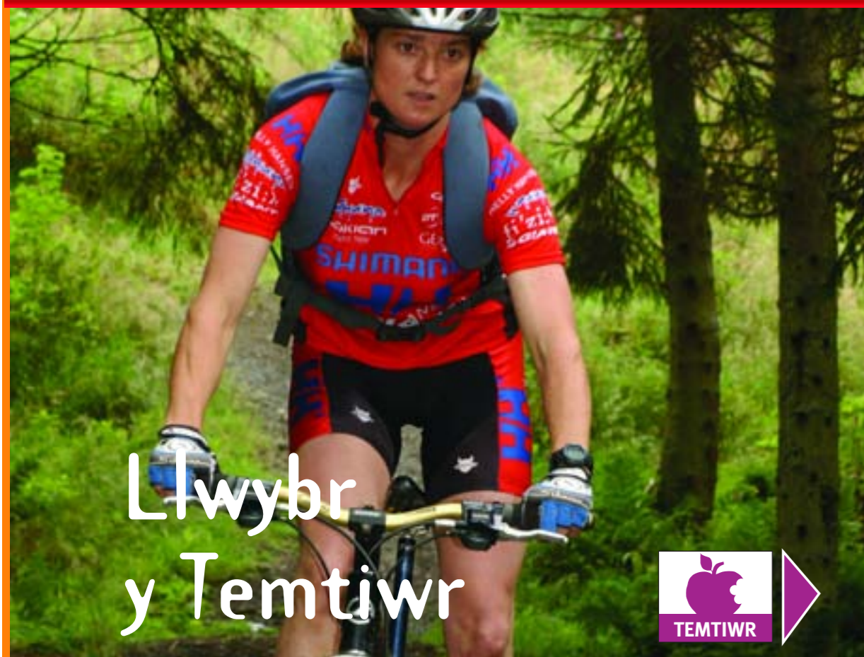
Llwybr y Temtiwr